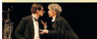
DIE ORCHESTERPROBE Komödie 22.09.