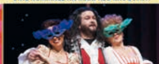
EINE NACHT IN VENEDIG Operette 29.09.