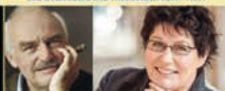
EINE HOMMAGE AN MANFRED KRUG 23.09.