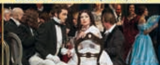
LA TRAVIATA Opern-Premiere 15.09.