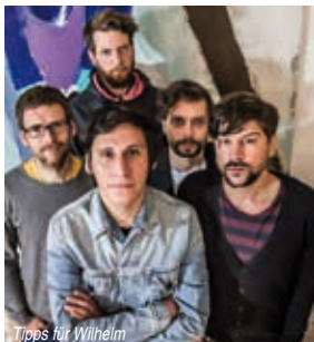
Tipps für Wilhelm

Das Programm startet mit einem Konzert von „Hanba!“. Das sind vier Musiker aus Krakau, die mit Banjo, Tuba, Akkordeon und Trommel ausgestattet sind. Am Freitag, dem 1. September, präsentierten sie Folk, Punk und Klezmer, wie man es noch nie erlebt hat. Indie-Pop aus Berlin gibt es am Samstag, dem 9. September, von der Band „Tipps für Wilhelm“. Am Freitag, dem 15. September, gastieren mit „Skavaria“ acht Musiker aus Regensburg, die sich zum Ziel gesetzt haben, nur Stücke zu spielen, die in Beine und Ohren gehen. Zum Weltkindertag am Sonntag, dem