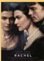
Drama, Romanze, Thriller Regie: Roger Michell

KINO - Scala / Regina - Wörthstr.4 - Tel. 36 84