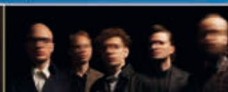
WOODS OF BIRNAM Shakespeare-Pop 09.09.