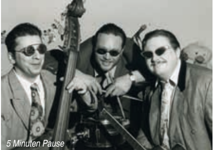
5 Minuten Pause