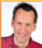
Mo., 9. Oktober JÖRG KAISER fränkischer Comedian

Täglich von 12-18 Uhr auf UKW 88.0, im Kabel und auf DAB + 24 Stunden web-radio: www.extra-radio.de