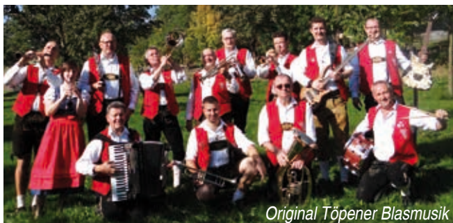
Original Töpener Blasmusik

Die Konzert-Saison im Musikpavillon am Haus Theresienstein in Hof neigt sich dem Ende entgegen. Die Besucher erleben nochmal zwei Sonntage mit einzigartigen Musikerlebnissen. Am 3. September spielt erstmalig die Original Töpener Blasmusik, die schon über die Grenzen Deutschlands hinaus aufgetreten ist, von Österreich über die USA bis nach Südafrika. Ihr Repertoire reicht von der typischen Blasmusik über Bigband-, Unterhaltungs- und Stimmungsmusik bis hin zur modernen Tanzmusik. Zum Abschlusskonzert am 10. September spielen die Haislamusikanten des Fichtelgebirgsvereins Hof. Die 17-köpfige Blaskapelle ist den Wurzeln der traditionellen bayerisch-böhmisch-fränkischen Blasmusik verpflichtet.