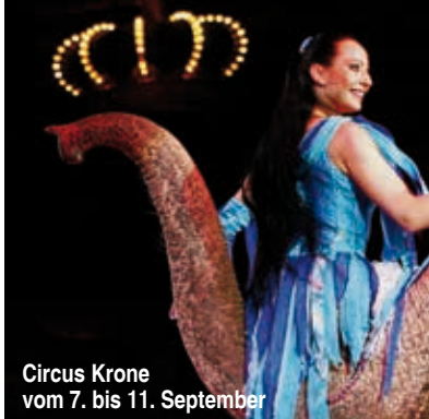
Circus Krone vom 7. bis 11. September