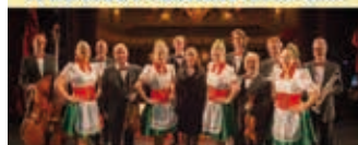
GROSSE JOHANN-STRAUSS-GALA 13.09.