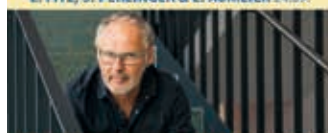
REINHOLD BECKMANN & BAND Konzert 30.09.