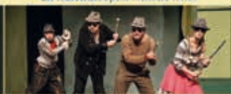
DIE BREMER STADTMUSIKANTEN 17.09.