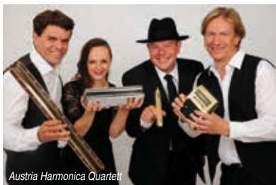
Austria Harmonica Quartet

Vom 12. bis zum 17. September findet das „Mundharmonika-Live-Festival“ in Klingenthal statt. Diese traditionelle Veranstaltung mit Workshops, Konzerten und einem Bluesharmonikawettbewerb, sowie weiteren Angeboten rund um das beliebte Tascheninstrument lockt jährlich zahlreiche Gäste in die Stadt am Aschberg. Es werden Mundharmonikavirtuosen aus Südamerika begrüßt, aber auch aus den Niederlanden, aus Ungarn, der Slowakei, aus der Schweiz, Österreich und weiteren Ländern. Der musikalische Höhepunkt ist das Galakonzert am Samstag, dem 16. September. Dann tritt das Mundharmonika Quartett Austria in der Aula der Schule am Amtsberg auf. Es präsentiert neue Lieder sowie Klassiker, Blues- und Rockpop-Songs. Kleine Improvisations-Parts und witzige Effekte geben den Stücken eine ganz persönliche Note. Zur großen Live-Nacht in zehn Lokalen sorgen Bands für Hochstimmung bis weit nach Mitternacht. Informationen zum Programm gibt es unter www.mundharmonika-live.de