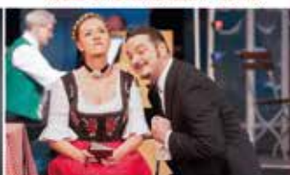
» IM WEISSEN RÖSSL « Operette - 31.10.