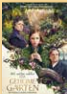
Fantasy, Familie, Drama Regie: Marc Munden

Fabelwesen sind beinahe ausgestorben. Nur an wenigen Orten auf der Erde finden sie noch Zuflucht. Genau so ein Ort ist der Dschungel, in dem sich der Silberdrache Lung verstecken muss. Lung macht sich gemeinsam mit dem Koboldmädchen Schwefelfell auf die Suche nach dem Saum des Himmels. Unterwegs treffen die beiden auf den Waisenjungen Ben, der sich als Drachenreiter ausgibt. Das außergewöhnliche Trio muss lernen, zusammen statt gegeneinander zu arbeiten. Ab 0 Jahren.