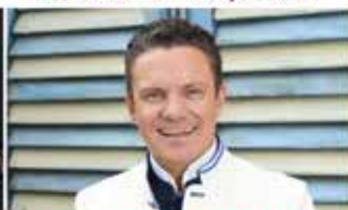
STEFAN MROSS & GÄSTE - 11.10.