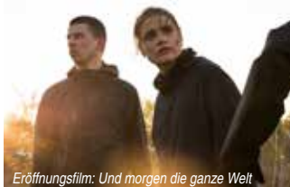
Eröffnungsfilm: Und morgen die ganze Welt

Der Eröffnung der Hofer Filmtage am Dienstag, dem 20. Oktober, startet mit dem spannenden, gesellschafts-politischen Drama „Und morgen die ganze Welt“ von Regisseurin Julia von Heinz. Es dreht sich um die 20-jährige Luisa, einer Erstsemester-Jurastudentin, die alarmiert von dem Rechtsruck im Land und der zunehmenden Beliebtheit populistischer Parteien etwas in Deutschland verändern will. Schon bald muss sie sich entscheiden, wie weit sie für ihre Überzeugungen bereit ist zu gehen, auch wenn das fatale Konsequenzen für sie und ihre Freunde haben könnte. Der Film setzt ein aufrüttelndes Statement gegen den Populismus und regt zum Hinterfragen an.