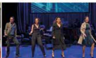
» BEST OF BROADWAY « - 24.10.