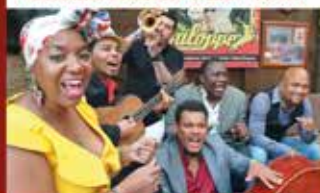
» HABANA TRADICIONAL « - 23.10.