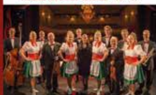
» JOHANN-STRAUSS-GALA « - 16.10.