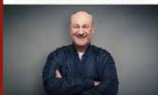
BODO BACH Best-of-Comedy - 30.10.