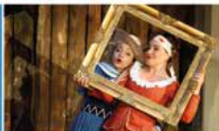
» DER FREISCHÜTZ « Oper - 04.10.