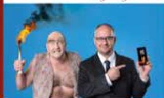
SCHWARZE GRÜTZE Kabarett - 02.10.