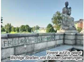
Vorerst auf Eis gelegt: Wichtige Straßen- und Brücken-Sanierungen

„Wir schaffen das!“ war der prägende Ausspruch der Kanzlerin, als es darum ging, eine große Anzahl von Flüchtlingen bei uns aufzunehmen. Die Stadt Hof hat kräftig geholfen und schutzsuchenden Menschen ein neues Zuhause geboten. So hat sich die Einwohnerzahl erhöht, die Geburtenrate ist gestiegen. Um Integration erfolgreich zu machen, muss man sich auch um