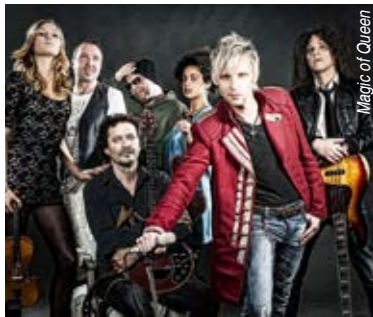
Magic of Queen

abestimmungen mit 25% Saalbelegung tatsächlich seit längerer Zeit ausverkauft ist. Für dieses Konzert konnte aber ganz schnell ein neuer Termin vereinbart werden. Am Dienstag, dem 1. Februar, also unmittelbar nach der Wieder-Eröffnung des Theaters, dann allerdings unter den dann geltenden Corona-Vorschriften. Doch die Eintrittskarten bleiben gültig. Weiter geht es mit „The Magic