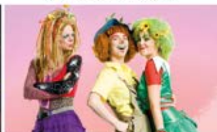
Der Traumzauberbaum · 07.07.