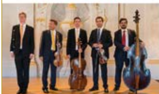
Concilium Musicum Wien · 28.07.