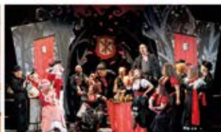
Das Wirtshaus im Spessart · 27.07.

Infos & Tickets: + 49 (0) 3 74 37 / 53 900