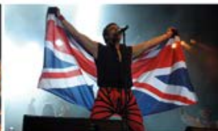
Queen Classical · 06.07.