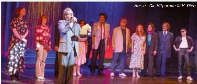
Hossa - Die Hitparade

Sparen Sie mit einem Theater- oder Konzertabonnement und erhalten Sie eine Freikarte für Hossa 4 am 11.07.24.