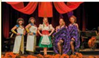
Johann-Strauß-Gala · 13.07.