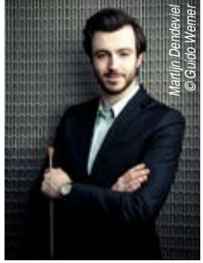
Martijn Dendievcl