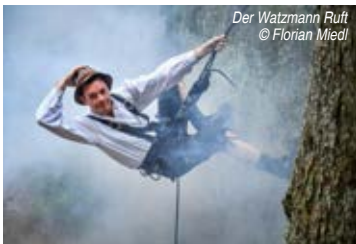
Der Watzmann Ruft

Jedes Jahr im Sommer verwandelt sich das Felsenlabyrinth auf der Luisenburg in eine Bühne für außergewöhnliche Theatererlebnisse unter freiem Himmel. Mit einer Vielfalt von Aufführungen, die von klassischen Stücken bis zu modernen Interpretationen reichen, bietet das Programm für jeden Geschmack etwas. Den Anfang machte „Pippi Langstrumpf“, das beliebte Familienschauspiel nach dem Kinderbuch von Astrid Lindgren. Shakespeares „Ein Sommernachtstraum“ entführt das Publikum in eine Welt voller Elfen und Feen, die in einem geheimnisvollen Wald ihr Unwesen treiben. Die Rockoper „Jesus Christ Superstar“ von Andrew Lloyd Webber und Tim Rice, neu übersetzt und erstmalig auf der Luisenburg aufgeführt, beleuchtet die letzten Tage im Leben von Jesus Christus. „Der Watzmann ruft“ ist eine satirische Aufführung, die das Volkstheater mit Rock'n'Roll vereint und dabei kein Klischee auslässt. Zusätzlich bereichern drei Gastspiele das Programm: „Extrawurst“, eine Dramödie in zwei Akten, „Die lustigen Nibelungen“, eine Operettenparodie auf Wagners Epos, und Wagners „Der fliegende Holländer“, eine Oper, die von unerfüllter Liebe und ewiger Sehnsucht erzählt. Mehr unter www.luisenburg-aktuell.de .