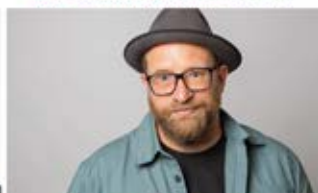
Gregor Meyle & Band · 20.07.