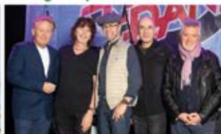
Manfred Mann's Earth Band · 26.07.