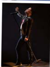
Donnerstag, 17.10. ONE VISION OF QUEEN FEAT. MARC MARTEL