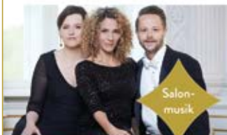
Pariser Flair · 21.07.