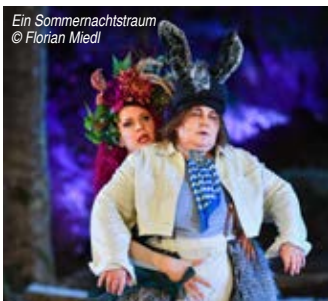
Ein Sommernachtstraum © Florian Miedl