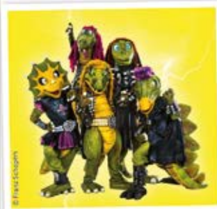
Sonntag, 15.09. HEAVYSAURUS