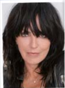
Dienstag, 15.10. NENA